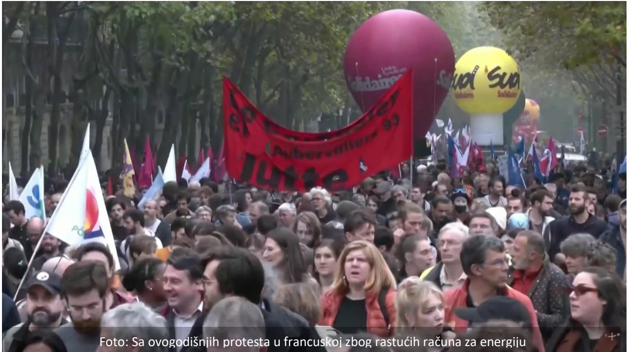
Foto: Sa ovogodišnjih protesta u francuskoj zbog rastućih računa za energiju

BRISEL - EU se suočava sa "stvori, ili prekini trenutkom" za dekarbonizaciju ako želi da se drži evropskog zelenog dogovora, upozorava se u novom izveštaju, usred krize troškova života, višestrukih izbora i sve većeg političkog "zelenog udara".