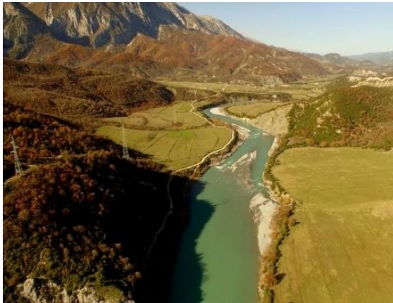
Reka Vjosa

Sekretarijat je pozvao Albaniju da u roku od dva meseca odgovori na ove navode i da omogući Sekretarijatu da utvrdi potpunu pozadinu slučaja".