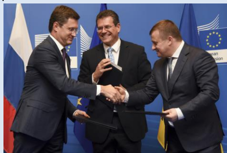
Foto: Sa ceremonije potpisivanja

Trilateralni protokol za zimski paket, o uslovima po kojima ukrajinska kompanija Naftogas može da uveze dve milijarde kubnih metara prirodnog gasa od ruskog Gasproma za 500 miliona dolara pokriva period od 1. 10. 2015. do 31. 03 2016.