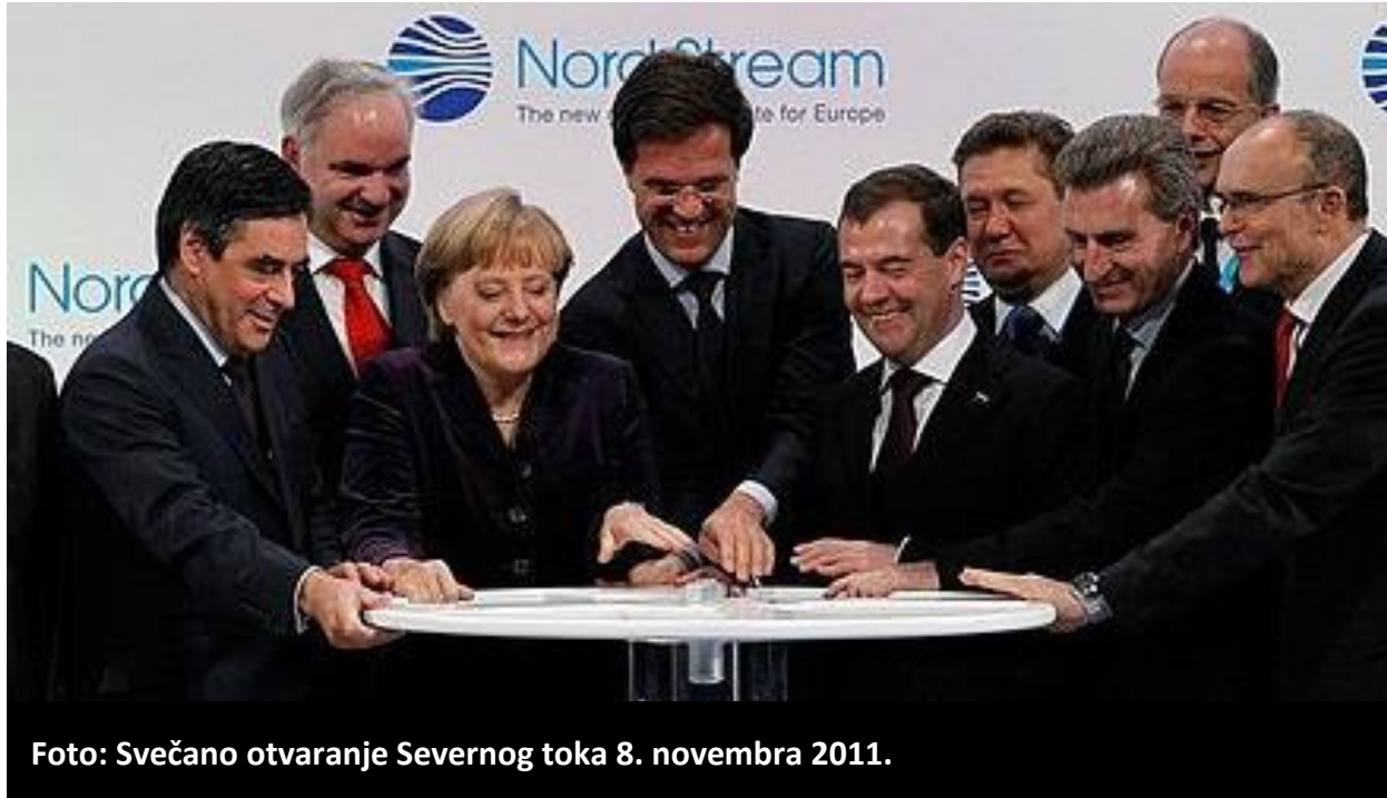
Foto: Svečano otvaranje Severnog toka 8. novembra 2011.

VLADIVOSTOK - Ruski Gasprom i partneri sklopili su u petak, u okviru Istočnog ekonomskog foruma koji se održava u Vladivostoku, sporazum akcionara za gradnju gasovoda Severni tok 2, koji će povećati isporuku ruskog prirodnog gasa Evropskoj uniji. Dokument su potpisali čelnici Gasproma, nemačkih BASF-a i E.ON-a, francuskoj ENGIE-a, austrijskog OMV-a i holandsko-britanskoj Royal Dutch Shell-a. Za realizaciju projekta zadužena je zajednička kompanija New European Pipeline, u kojoj će Gasprom imati 51 posto udela, E.ON, Shell, OMV i BASF/Wintershall