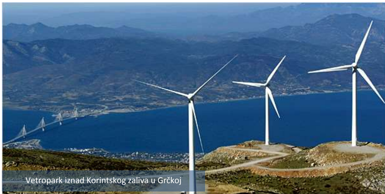
Vetropark iznad Korinskog zaliva u Grčkoj

ATINA – Vlada Grčke usvojila je ove nedelje novi zakon kojim značajno menja pravila na tržištu obnovljivih izvora energije, posebno u oblasti solarne energije, gde ukida zabranu na postavljanje novih kapaciteta uvedenu avgusta 2012. Biće određena godišnja kvota podsticajnih tarifa (FIT) za solarne kapacitete od ukupno 250MW kada zakon, kako se očekuje, bude usvojen do kraja ovog meseca. Zakon takođe određuje permanentne retroaktivne rezove (u proseku za 30%) na FIT za postojeće solarne kapacitete i