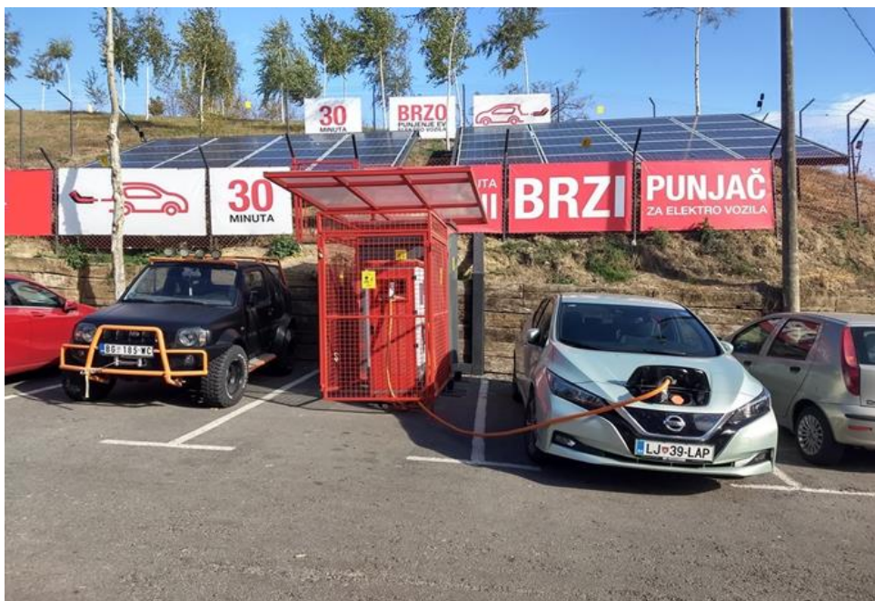
SLIKA 2 DC PUNJAČ SNAGE 50 KW SA SKLADIŠTEM ENERGIJE I SOLARNIM PANELIMA SNAGE 10 KW

Sagledavajući nominalne snage gore navedenih punjača, jasno je da snaga koja je potrebna za priključenje ovih punjača na distributivnu mrežu, ide od 22 kW pa do 350 kW, a sa razvojem tehnologije ići će i do 500 kW.